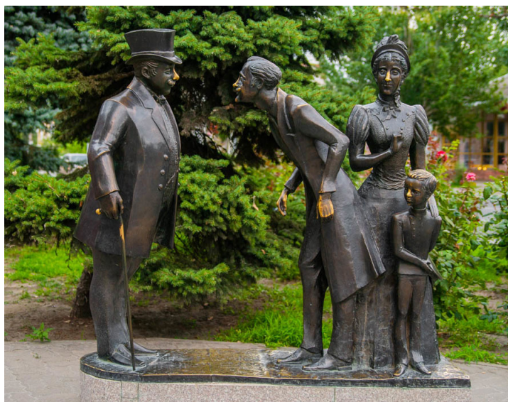
Рисунок 5. Памятник героям рассказа в Таганроге.