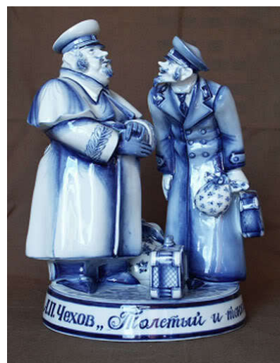
Рисунок 4. Статуэтка из фарфора. Автор Азамат Асанбаев.