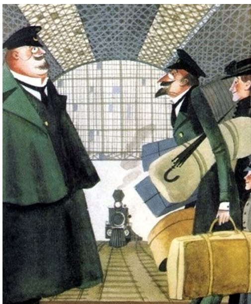
Рисунок 1. Иллюстрация Сергея Алимова.